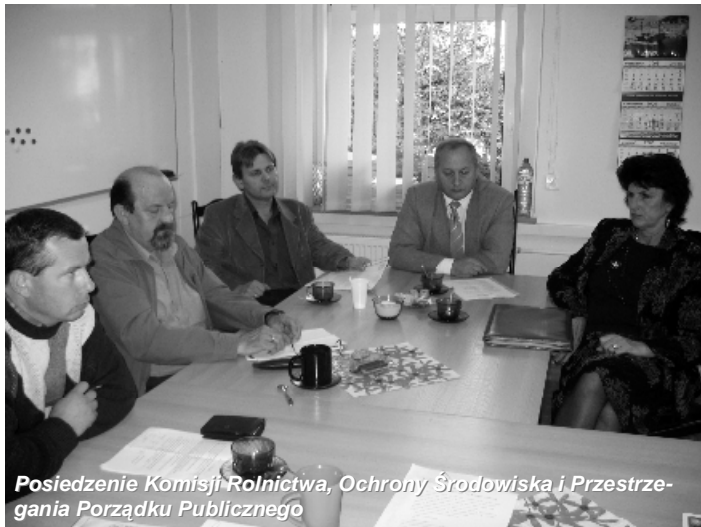
Posiedzenie Komisji Rolnictwa, Ochrony Środowiska i Przestrzegania Porządku Publicznego