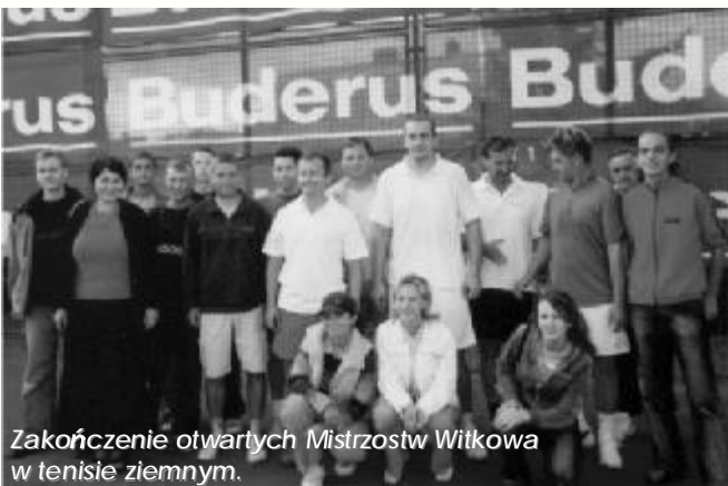
Zakończenie otwartych Mistrzostw Witkowa w tenisie ziemnym.