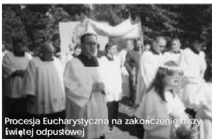
Procesja Eucharystyczna na zakończenie mszy świętej odpustowej