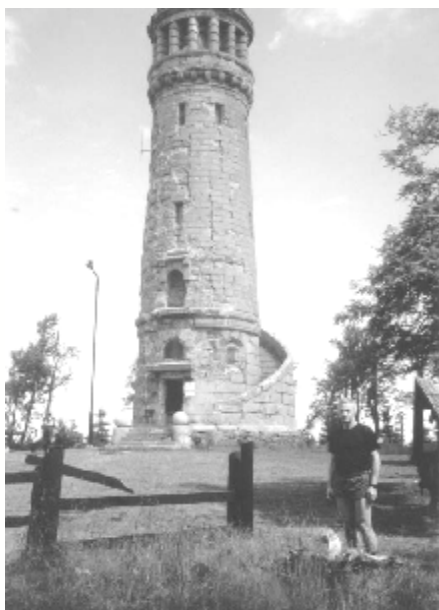
Zabytkowa wieża widokowa na szczycie Wielkiej Sowy

w partiach szczytowych dużymi blokami skalnymi) i Waligóra (936m z bardzo stromym podejściem). Starałem się też na każdym ważnym dla mnie punkcie zrobić zdjęcie, ale zawsze byłam